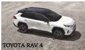
TOYOTA RAV 4

2 Boulevard des Arènes - 30000 Nîmes 04 66 67 68 69