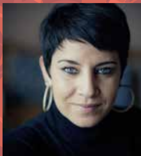
Yana BOUKOFF mezzo-soprano